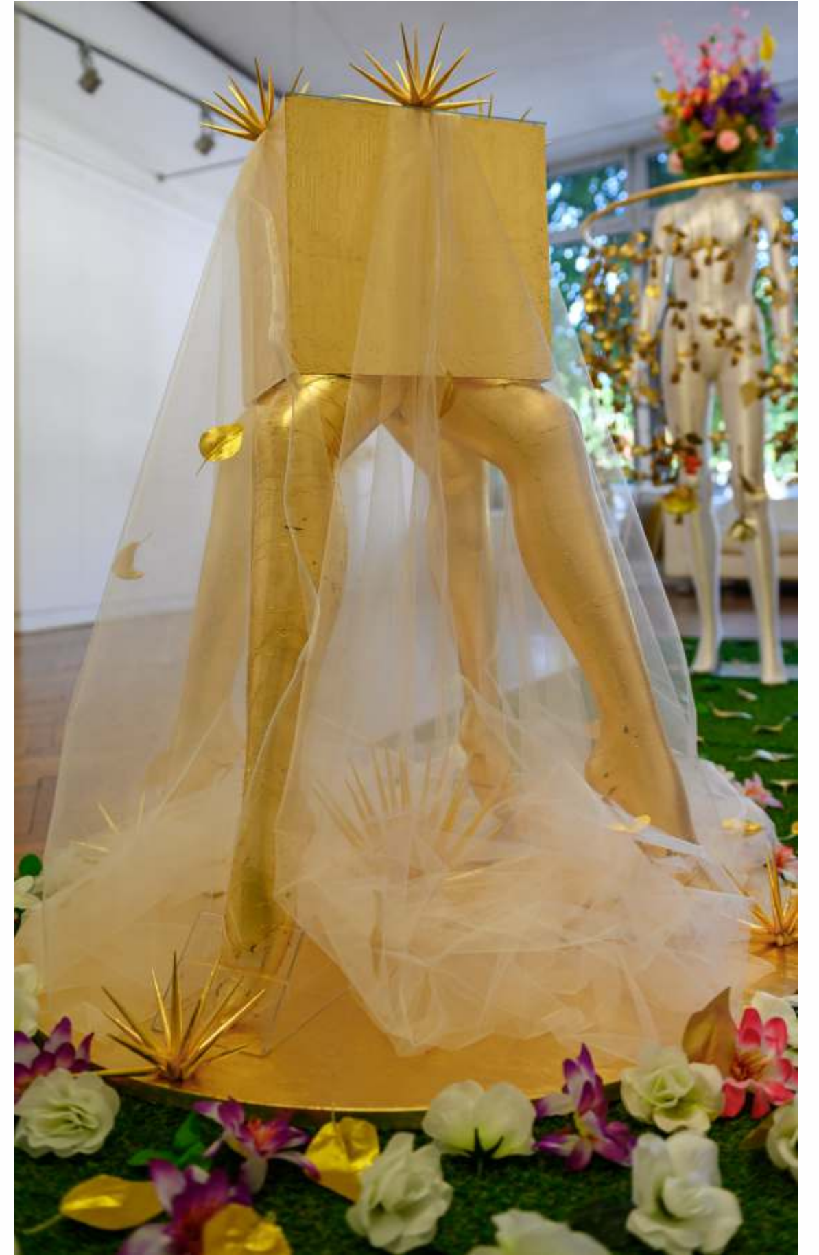
Райска градина / 2022 Garden of Eden / 2022