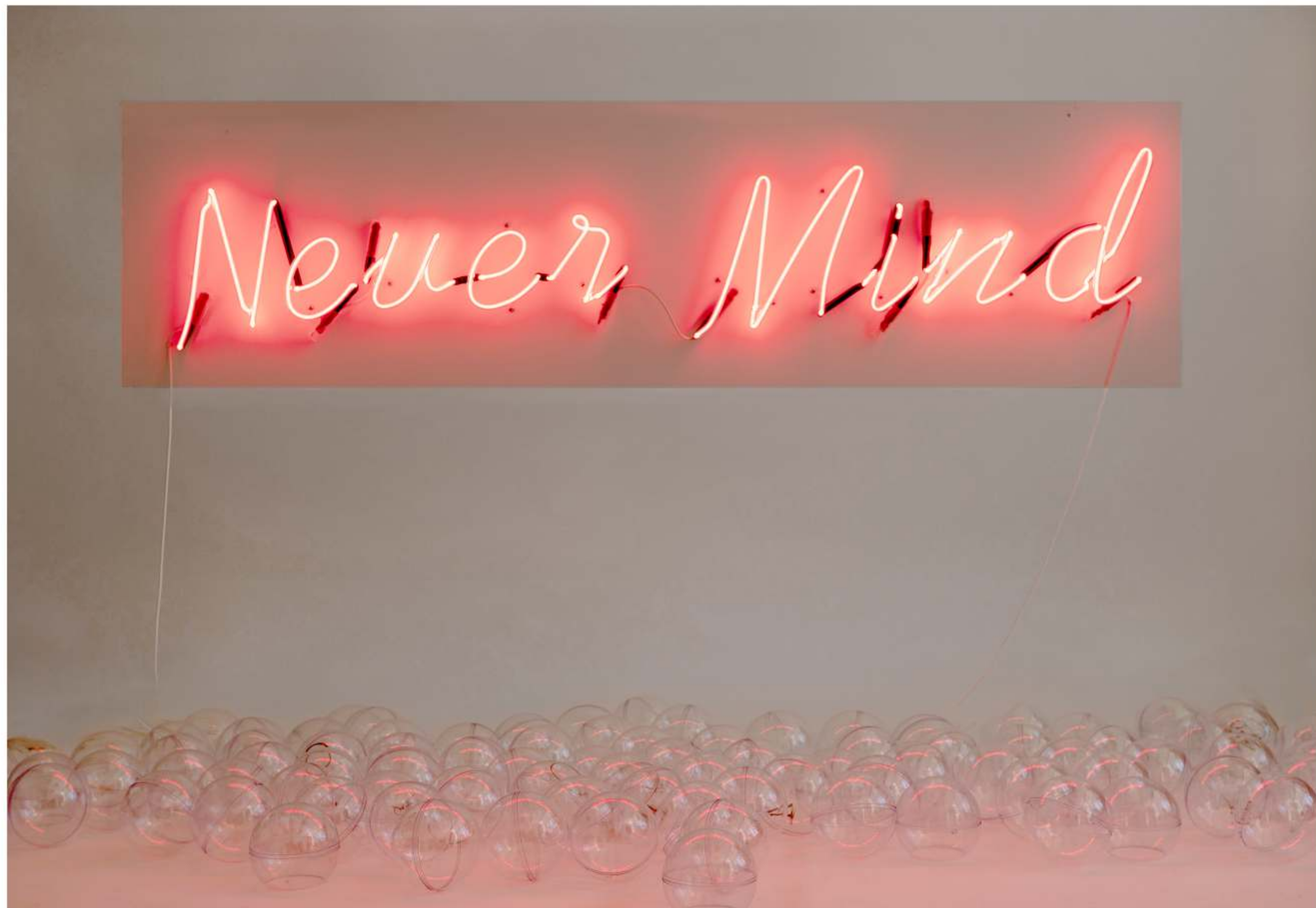
Светец неонов надпис / 2022 / 40 x 140 см Glowing neon / 2022 / 40 x 140 cm