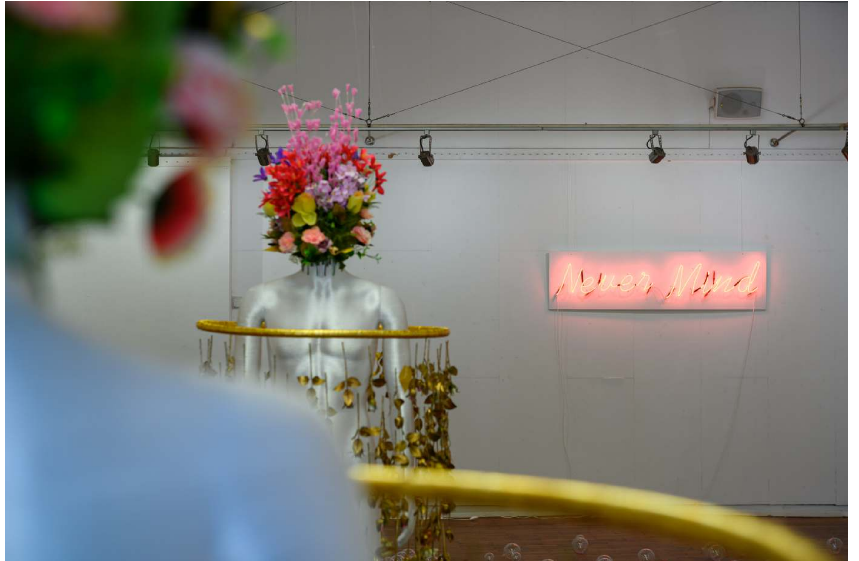
Изглед от изложбата View of exposition