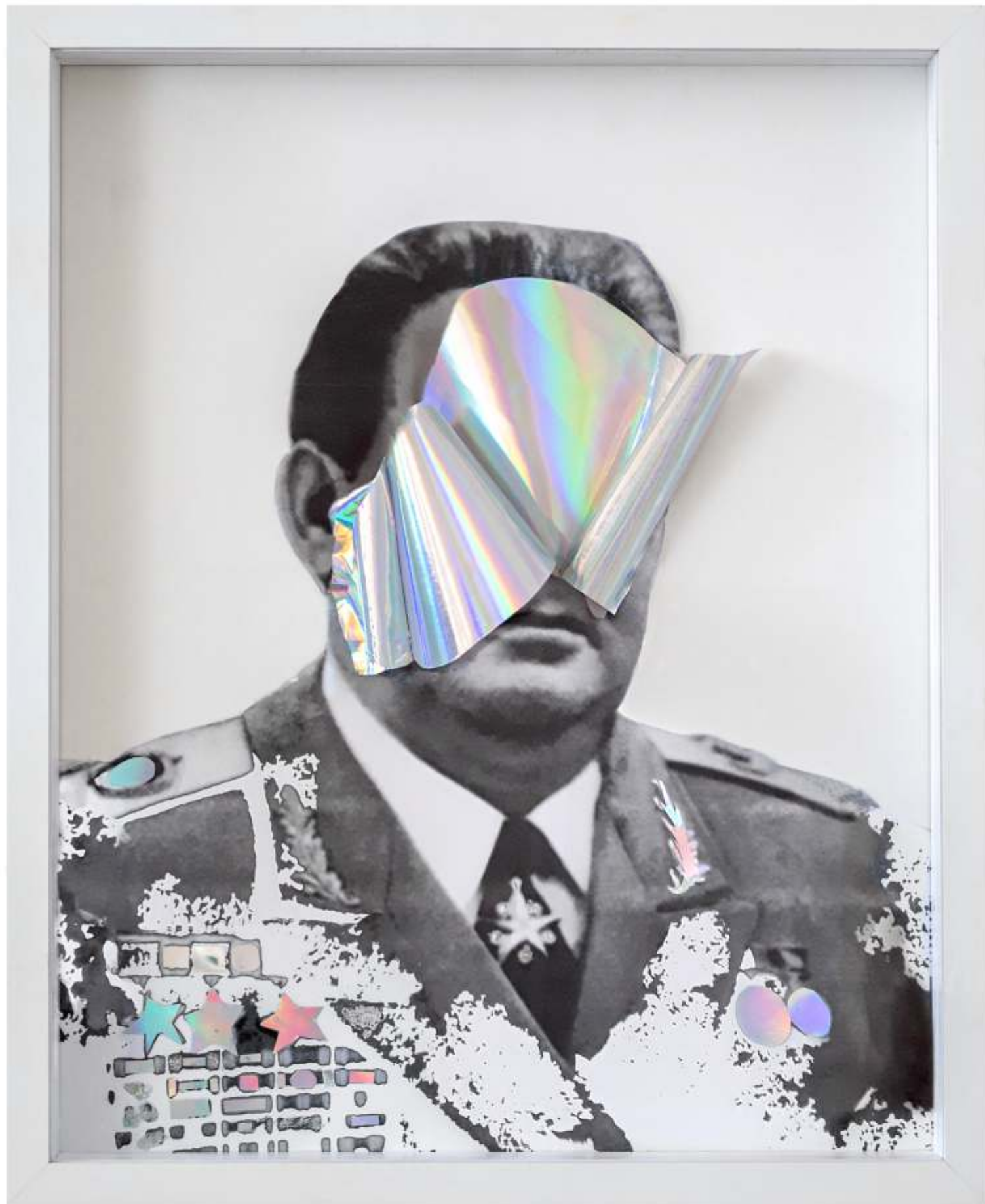
Диктатор 1 / 2022 / колаж / 50 x 40 см Dictator 1 / 2022 / collage / 50 x 40 cm