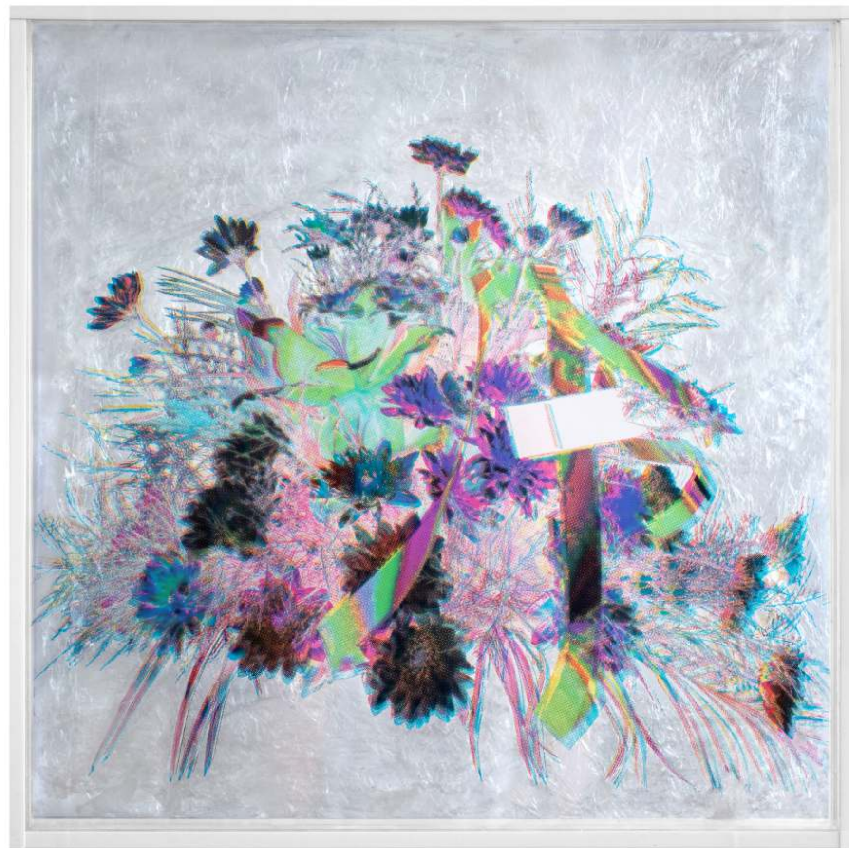
Цвета 5 / 2022 / дигитален принт на PVC / 75 x 75 x 8 см Flowers 5 / 2022 / digital print on PVC / 75 x 75 x 8 cm