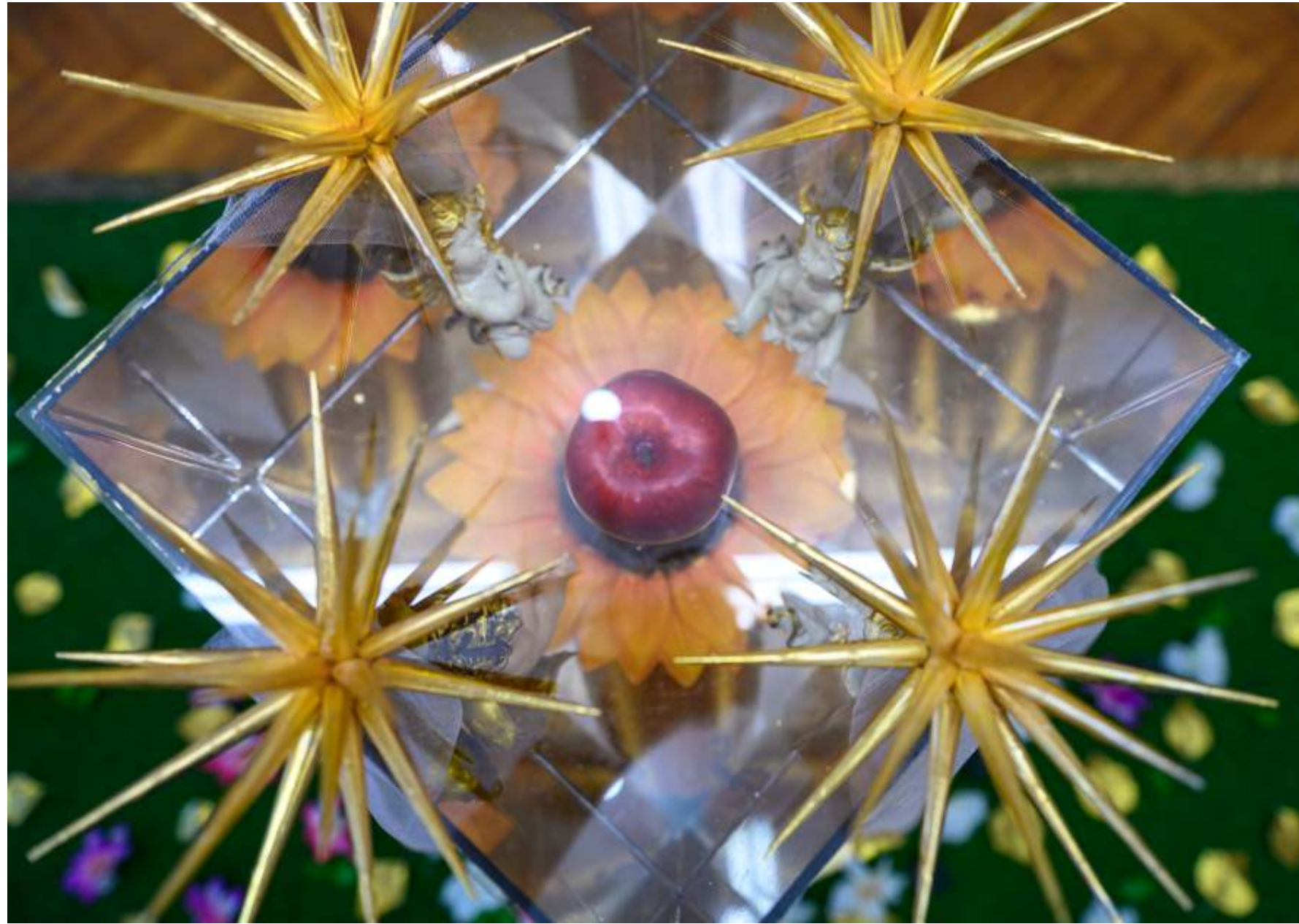
Детайл / Райска градина / 2022 Part / Garden of Eden / 2022