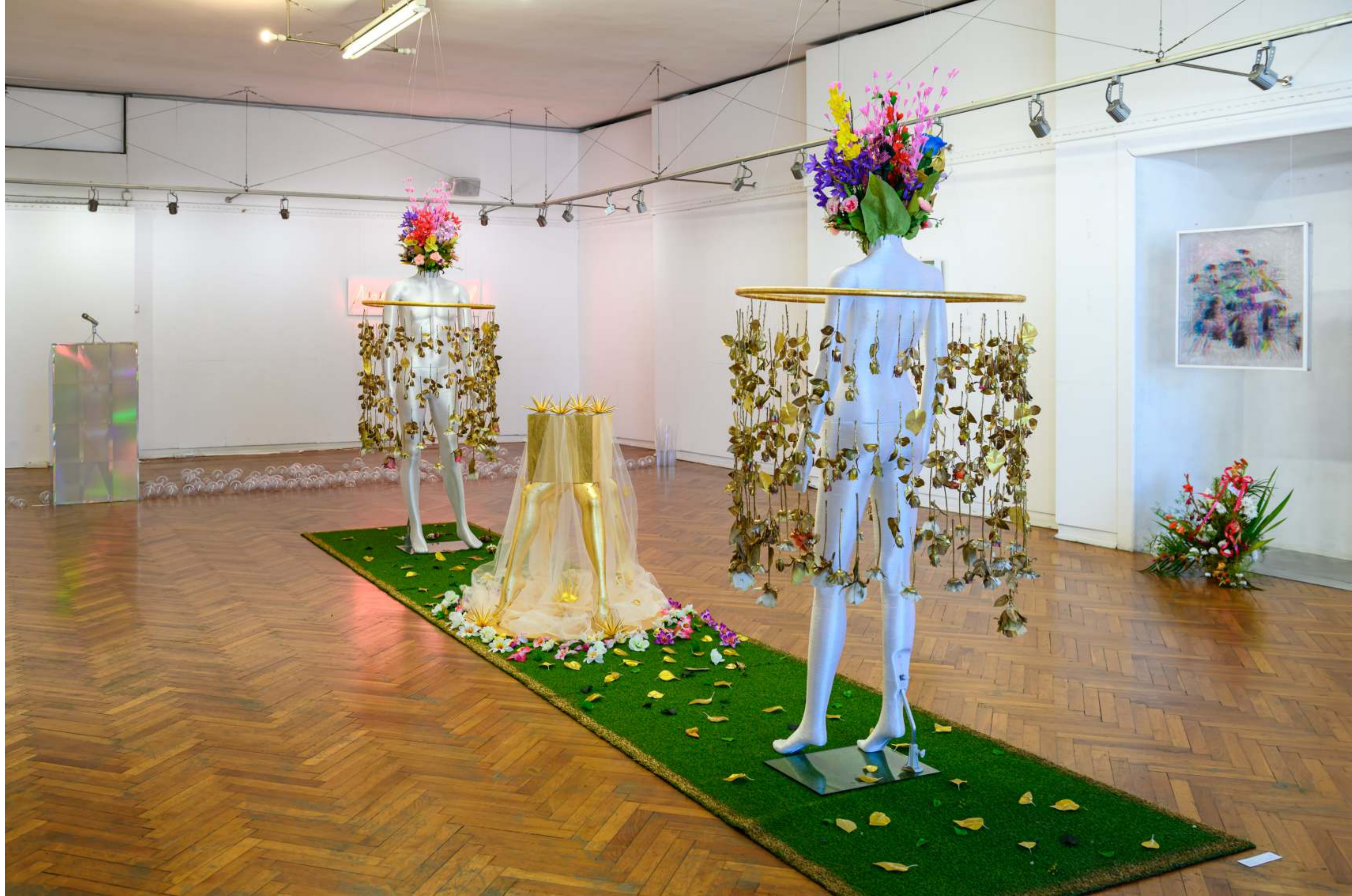
Изглед от изложбата View of exposition