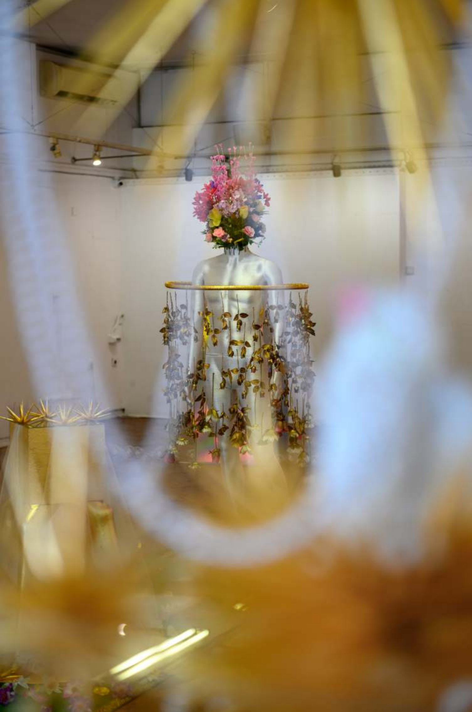
Детайл / Райска градина / 2022 Part / Garden of Eden / 2022